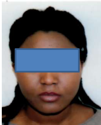
E.T. classe 1991 - Nigeria

Tratta in arresto in questo capoluogo da personale della Squadra Mobile Sezione Criminalità Organizzata e Straniera